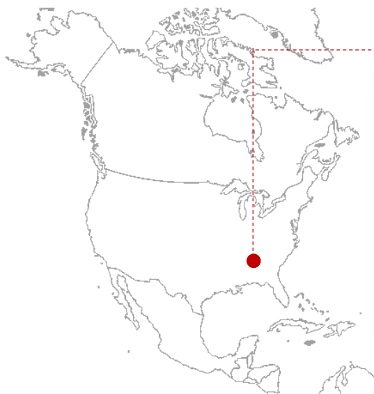
Summit Bechtel Reserve

Le Jamboree 2019 se tiendra aux USA dans le Sud de la Virginie occidentale dans le SBR, « Summit Bechtel Reserve » un site aventureux.